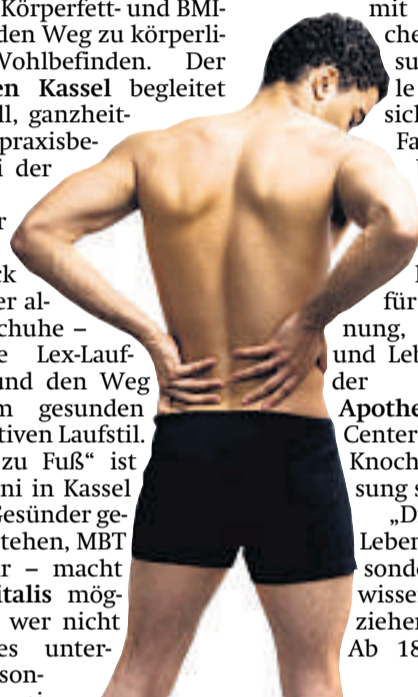
Das Kreuz mit dem Kreuz: Immer mehr Menschen leiden unter Rückenbeschwerden.

mit einer Körperfett- und BMI-Messung den Weg zu körperlichem Wohlbefinden. Der Lauf-Laden Kassel begleitet individuell, ganzheitlich und praxisbezogen bei der richtigen Wahl der Laufschuhe – Check vor Ort der alten Laufschuhe – zeigt die Lex-Lauftechnik und den Weg zu einem gesunden und effektiven Laufstil. „Gesund zu Fuß“ ist am 17. Juni in Kassel wichtig. Gesünder gehen und stehen, MBT und mehr – macht forum vitalis möglich. Und wer nicht per pedes unterwegs ist, sondern auf zwei Rädern, erhält von edelmann bike